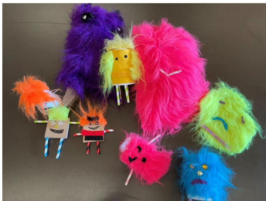
Illustrations d'activités en lien avec notre thème annuel : « La vie est un art »