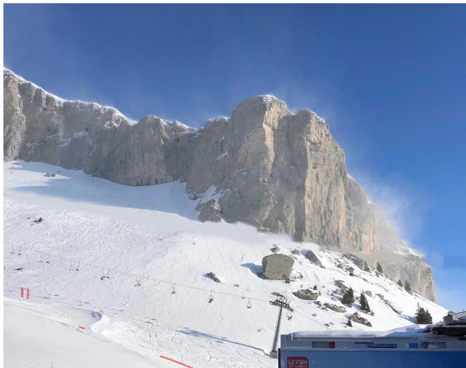
Le vent sur la tour d'Ai

L'annulation de la compétition pouvait être anticipée le matin même par la décision d'une première mesure : la fermeture du télécabine. La raison : l'annonce d'une journée venteuse. L'épreuve initialement prévue vers 9 heures a d'abord été reportée à 11 heures, puis finalement a été reportée