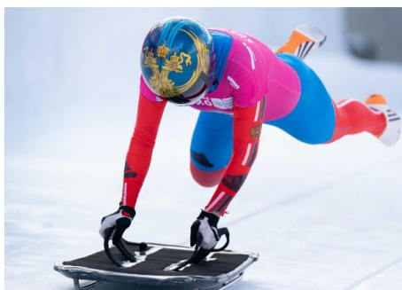
A nous la descente !

Le skeleton est un sport de glisse conçu dans les années 1880 à Saint-Moritz en Suisse. Le but est de descendre un couloir de glace de 1200 mètres le plus rapidement possible. La vitesse atteinte varie entre 120 et 140 km/m. Ce sport se pratique seul sur une planche de 80 à 120 centimètres. Le skeleton tient son nom de cette fameuse planche qui ressemble à un squelette.