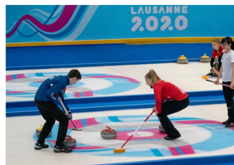
Tapera tapera pas ?

deux équipes de quatre joueurs sur une surface de glace rectangulaire? Son surnom de "roaring game" vient du grondement que fait la pierre de granit de 44 livres (19,96 kg) en se déplaçant sur la glace. Les règles du jeu: le match se déroule par équipes de 4. L'objectif est simple: lancer la pierre en direction de la cible. Pour la diriger, vous devez la faire glisser en frottant la glace avec un balai jusqu'à la faire se rapprocher du centre. Le concept ressemble beaucoup à la pétanque avec comme objectif d'avoir le plus de pierres dans la maison et de pousser celles des adversaires en dehors de celle-ci.