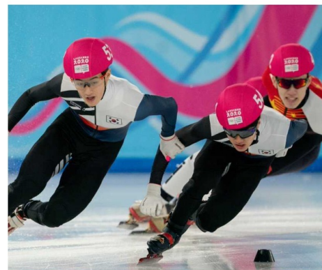
En constant équilibre...

Le short track est un sport qui se déroule sur une patinoire. Les concurrents s'élancent sur une surface standard de 60 mètres de long sur 30 mètres de large. Ils peuvent atteindre les 60km/h et peuvent s'incliner jusqu'à 60 degrés quand ils tournent dans les virages. La compétition se déroule sur 500m (4.5 tours de patinoire), 1000m (9 tours) et 1500m (13.5 tours). Quatre athlètes par course se trouvent sur la glace. Pour l'équipement, les athlètes ont une combinaison, une paire de patins dont la lame fait 35 et 50 centimètres... Pour se protéger des blessures, les "short trackers" peuvent