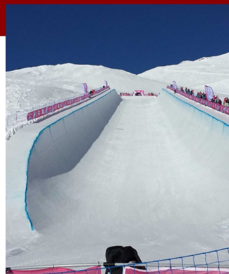
Halfpipe de Leysin.

L'épreuve de halfpipe est évaluée par des juges. Chaque concurrent effectue plusieurs manches individuelles en exécutant plusieurs figures, pirouettes et vrilles, dans un demi-tube de neige incliné. Le meilleur résultat des manches qualificatives est pris en compte pour l'accès à la finale. La finale se fait sur deux manches, le meilleur résultat est alors retenu. Les concurrents sont jugés sur plusieurs critères tels que l'amplitude, la difficulté technique, la créativité et la réception.