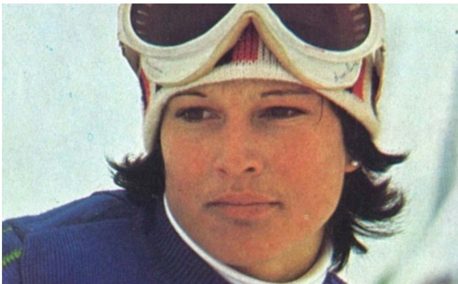
Lise-Marie Morerod, hiver 1976-1977.

À mon époque j'avais juste 5-6 mètres de piste faite et nous n'avions pas autant de drapeaux alors qu'aujourd'hui il y a une sacrée