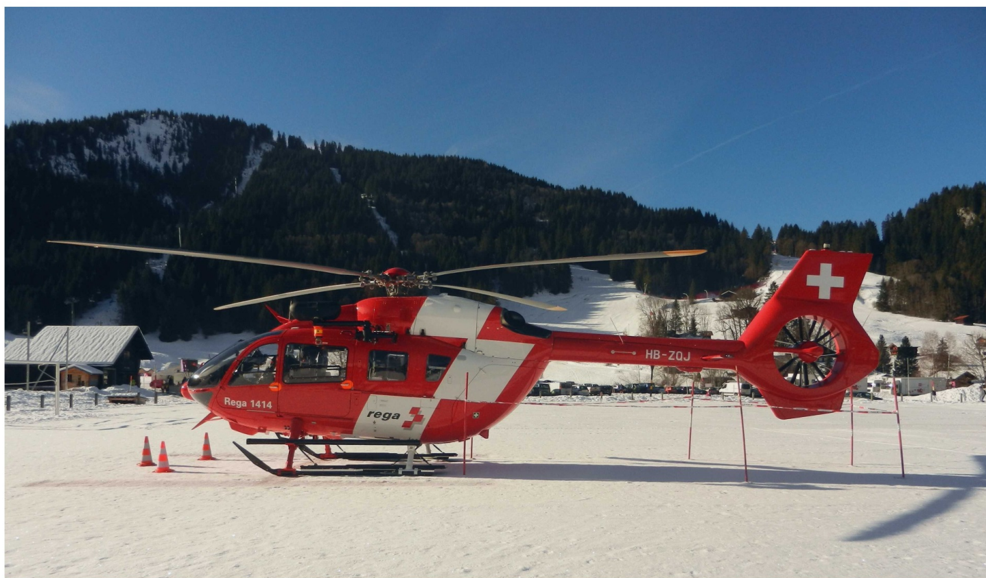
Hélicoptère de la Rega.