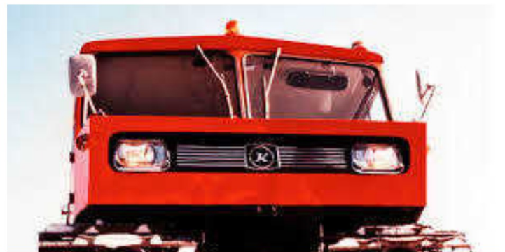
Premier prototype de Kässbohrer en 1967