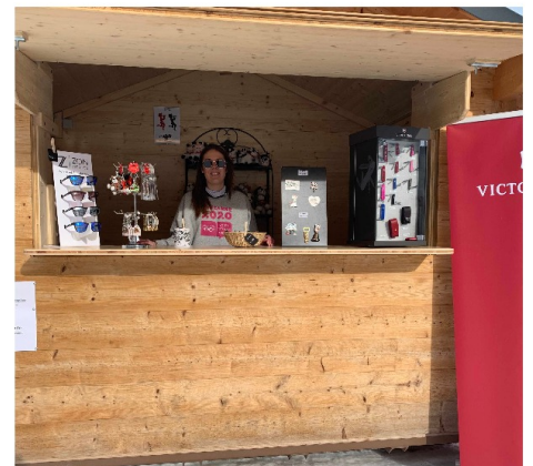
Le chalet du Bazar des Alpes en bas des pistes.

Bien sûr, les infrastructures sont opérationnelles à présent. Il faudrait certes envisager quelques aménagements, mais ça serait super de pouvoir accueillir les Jeux olympiques adultes.