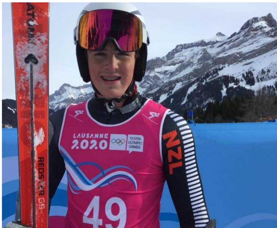
Harrison Messenger